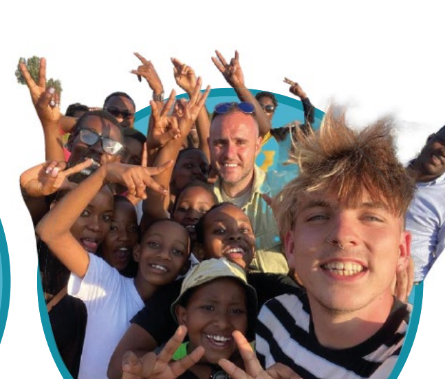
Jeunes du monde entier

Étudiants, scientifiques, scouts, innovateurs