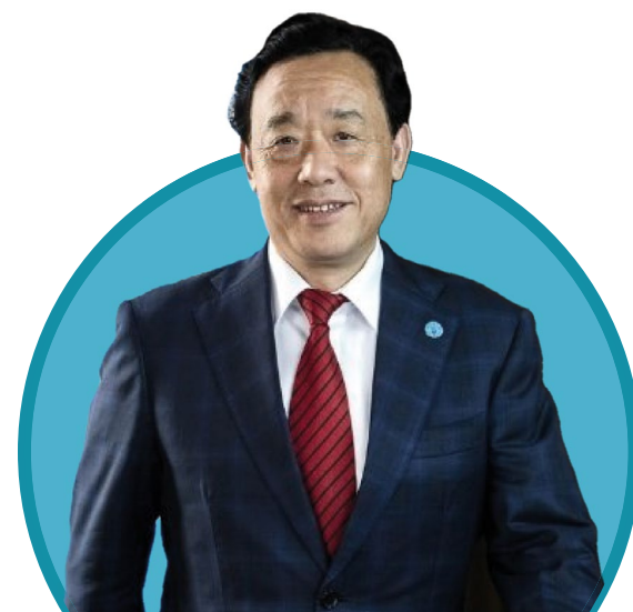
M. QU Dongyu

14 heures (heure d'été d'Europe centrale) Manifestation pour la jeunesse