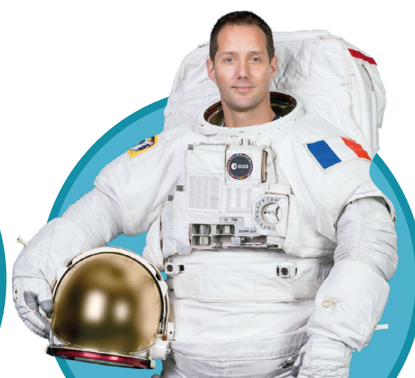
M. Thomas Pesquet

Spécialiste des médias et Ambassadrice de bonne volonté de la FAO pour le Proche-Orient et l'Afrique du Nord